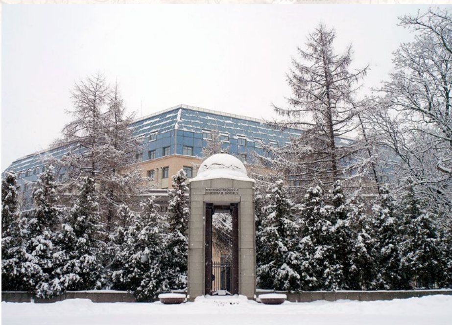
Площадь Военных Медиков