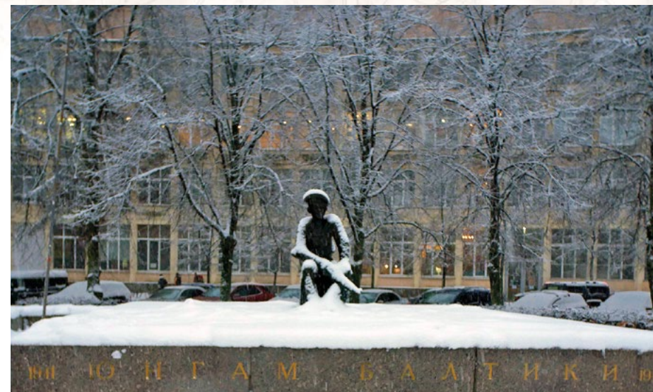
Площадь Балтийских Юнг