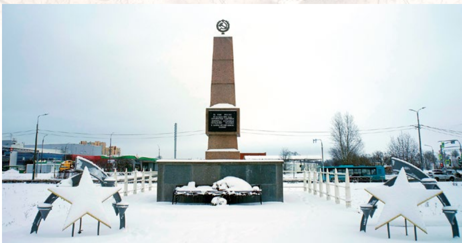
Сквер Передний Край Оборона