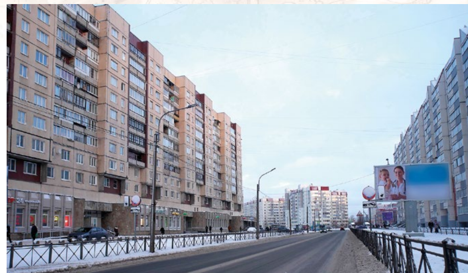
Улица Ижорского Батальона

30 сентября 1948 г. улице, проходящей в городе Колпино от Красной улицы и улицы Анисимова до Октябрьской улицы, было присвоено название улицы Ижорского Батальона. Оно увековечило знаменитую воинскую часть, созданную в начале Великой Отечественной войны из добровольцев – рабочих и служащих Ижорского завода. В летописи